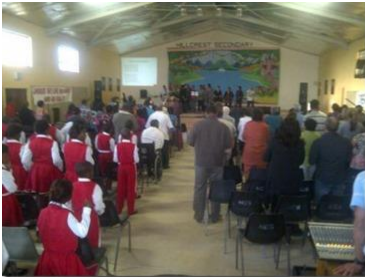
Ons was betrokke by verskeie interkerklike gebedsaksies soos Nations impact en Global day of prayer.